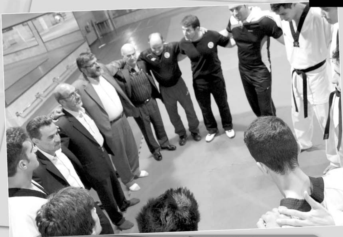
نایب قهرمانی جهان با تیم زیر ۲۳ ساله ها